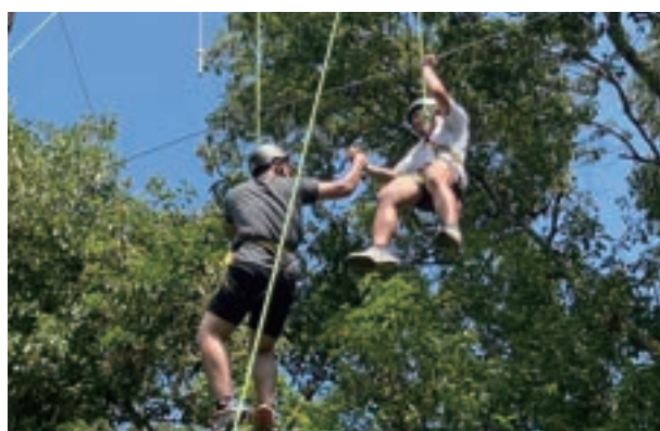
▲兩個人拉著細小的繩索抵達中間的位置，與夥伴擊掌才算完成挑戰