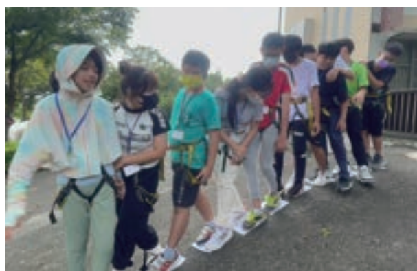
▲要一起協力合作踏上那張小小的白紙的硫酸河活動

我們來到二水國中學、源泉社區，一同在這個炎熱的暑假期挑戰自我，我們玩了攀岩、高低空溜索、黑泥田拔河河體驗，夜晚的纏繞畫、享用源泉社區的菜餚與寧靜，這兩天一夜的旅程轉瞬即逝，一個人完成的不是成功的關鍵，學習如何團隊合作，互相扶持、鼓舞彼此，並在挑戰過程中看見、肯定自己的艱辛和努力，才是最想要帶給大家的自我價值。