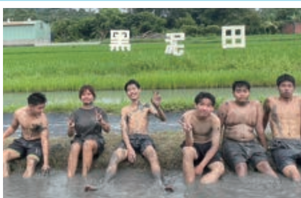
▲黑泥田拔河戰士們，臉越黑我越開心！