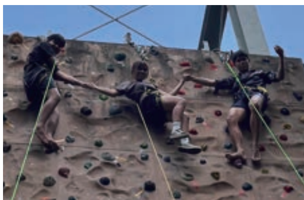
▲努力爬上四層樓高的攀岩牆，我與我的攀岩小夥伴一起登頂啦！